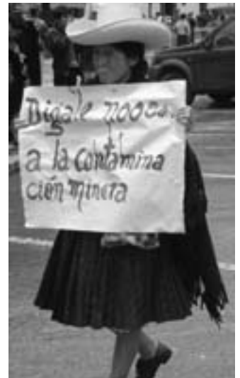
Protest gegen die Umweltzerstörung durch die Minen.

Inwieweit dies zutrifft, werden die Auskünfte der staatlichen Börsenaufsicht CONASEV (Comisión Nacional Supervisora de Empresas y Valores) zeigen. CNMM hatte sie aufgefordert, die von PERUBAR präsentierten Unternehmenszahlen vom letzten Jahr zu unter-