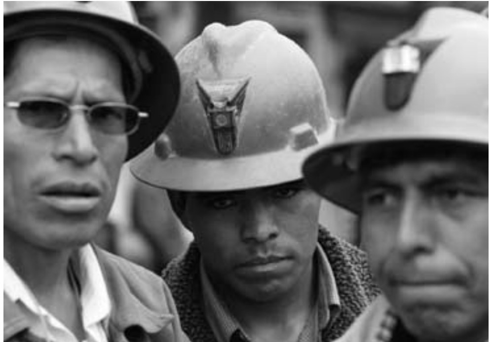
Minenarbeiter während eines Protestmarsches in der peruanischen Hauptstadt Lima.