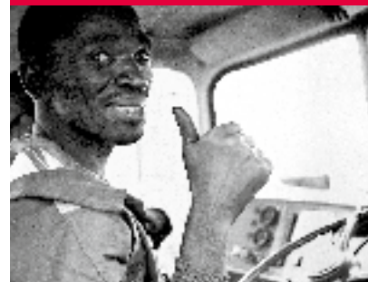
Ein Jubiläumsbuch aus der edition 8

25 Jahre SOLIFONDS/Solidaritätsfonds für soziale Befreiungskämpfe in der Dritten Welt