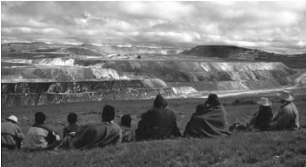
Die Minen haben tiefgreifende Auswirkungen auf das Leben der Gemeinden, Kleinbauernfamilien und Arbeiter.